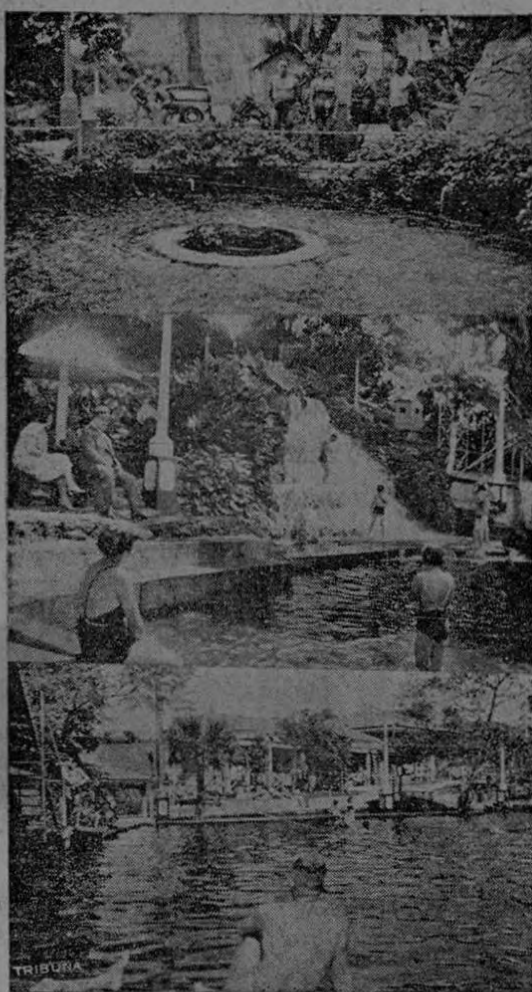
Bellísimos aspectos que ofrece la hermosa piscina del Balneario de Ojo de Agua, en la que se congregan los domingos y días de fiesta, cientos de personas a disfrutar de las delicias de la natación.